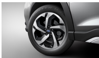
18-дюймовые легкосплавные диски (с 5 спицами)