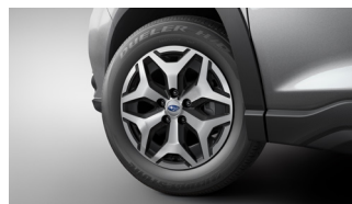
17-дюймовые легкосплавные диски