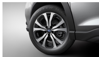
18-дюймовые легкосплавные диски (с 10 спицами)