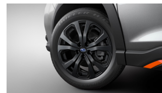
18-дюймовые легкосплавные диски (с 10 спицами) черного цвета для комплектации Sport

1. Указанные цены являются максимальными ценами перепродажи и наличие опций, указанные в комплектациях могут изменяться без предварительного уведомления, так как сведения о ценах и комплектациях носят исключительно информационный характер.